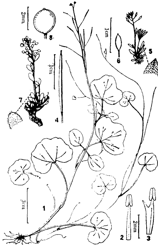
图1 1—4.肾叶碎米荠 Cardamine hydrocotyloides W. T. Wang 1.植株全形; 2, 3.雄蕊; 4.长角果。5—6.稻城葶苈 Draba daochengensis W. T. Wang 5.植株全形; 6.短角果。7—8.长毛葶苈 D. dolichotricha W. T. Wang 7.植株全形; 8.短角果。(吴彩桦绘)

Herba perennis. Rhizomata tuberculiformia, 4—8 mm crassa, radices fibrosas longas edentia. Caulis 10—20 cm alti, puberuli, basi interdum medio e foliorum axillis ramos steriles graciles 5—26 cm longos glabros foliis simplicibus 1—3 praeditos emittentes. Folia basalia pauca et ca caulina inferiora simplicia, longe petiolata; laminac tenuiter papyraceae, reniformes, 0.5—2.2 cm longae, 0.8—3.7 cm latae, apice leviter emarginatae, indistincte 3—5-lobatae vel indivisae, basi cordatae, supra pilosellae, subtus subglabrae, nervis obscuris; petioli 1.2—6 cm longi, glabri vel subglabri. Folia caulina cetera 3(-4)-foliolata, foliola terminalia forma varia, depresso pentagona, reniformia, suborbicularia vel orbiculari-ovata, 0.7—2.3 cm longa, 0.7—3.6 cm lata, apice emarginata vel rotundata, 3-lobulata, obscure 3-lobulata vel indivisa, basi subtruncata, cordata vel rotundata, lateralia minora, breviter petiolulata, elliptica vel late ovata, 0.6—1.8 cm longa, integra, utrinque pilosella, petioli 1—2.4 cm longi, glabri. Racemi terminales, 3—6 cm longi, 6—10-flori; rhachides pedicellique minute puberuli; pedicelli sub fructu usque ad 1.6 cm longi. Sepala ovata, circ. 2.2 mm longa, glabra. Petala alba, obovata, circ. 5.5 mm longa. Stamina circ. 3.5 mm longa, filamentis linearibus 0.25—0.5 mm latis raro 1 mm latis et apice 1-dentatis. Pistillum circ. 3.5 mm longum, glabrum. Siliquae 1.8—2 cm longae, 1 mm latae, glabrae, stylis persistentibus circ. 2 mm longis.