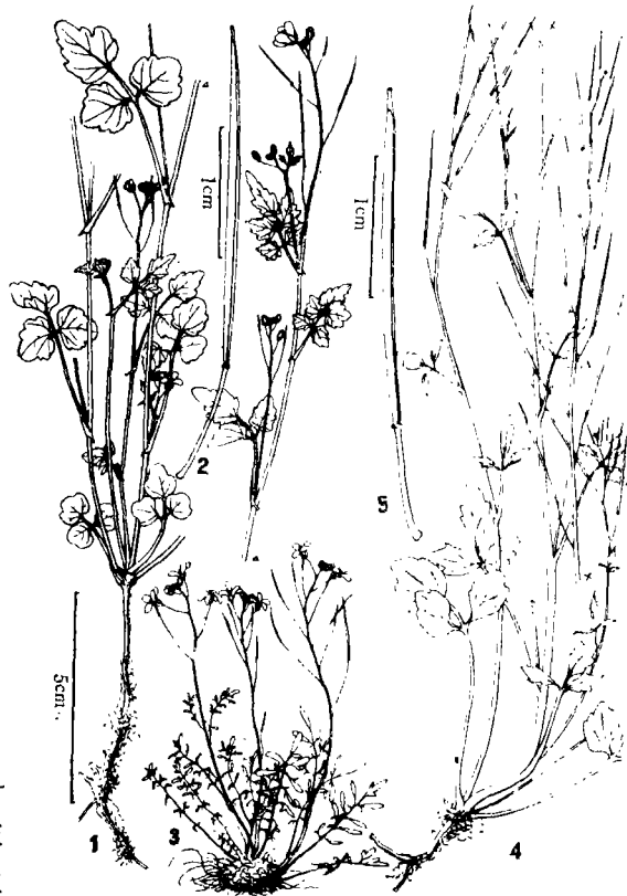
图2 1—2. 光茎碎米荠 Cardamine levicaulis W. T. Wang 1. 植株全形; 2. 长角果。3. 细裂碎米荠 C. caroides C. Y. Wu 植株全形。4—5. 维西碎米荠 C. weixiensis W. T. Wang 4. 植株全形; 5. 长角果。(刘春荣绘)

Herba annua. Caules 15—26 cm alti, e basi vel parte inferiore ramosi vel simplices, glabri vel sparsissime piloselli. Folia basalia pauca, sub anthesi saepe emarcescenda, petiolis inclusis 2—5 cm longa, 3—5-foliolata; foliola herbacea