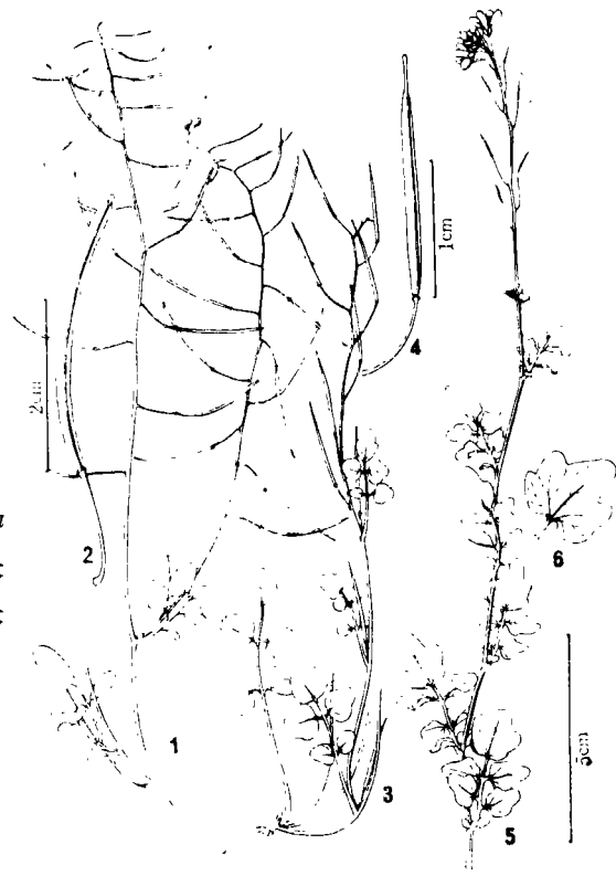
图4 1—2.黑水碎米荠 Cardamine heishuiensis W. T. Wang 1.具果序的枝条; 2.长角果。3—4.长柱碎米荠 C. longistyla W. T. Wang 3.植株全形; 4.长角果。5—6.五裂碎米荠 C. griffithii var. pentaloba W. T. Wang 5.植株中部及上部; 6.最下部基生叶的顶生小叶。(刘春荣绘)

Herba annua (?). Caules circ. 30 cm alti, e basi multiramosi, patule puberuli. Folia caulina petiolis inclusis 1.2—4.5 cm longa, 3—7-foliolata; foliola siccitate papyracea, terminalia elliptica, longe elliptica vel oblonga, 0.3—1.3 cm longa, apice obtusa vel rotundata, margine subintegra vel obscure 3-lobulata, lateralia minora, breviter petiolulata, elliptica, 1.5—7 mm