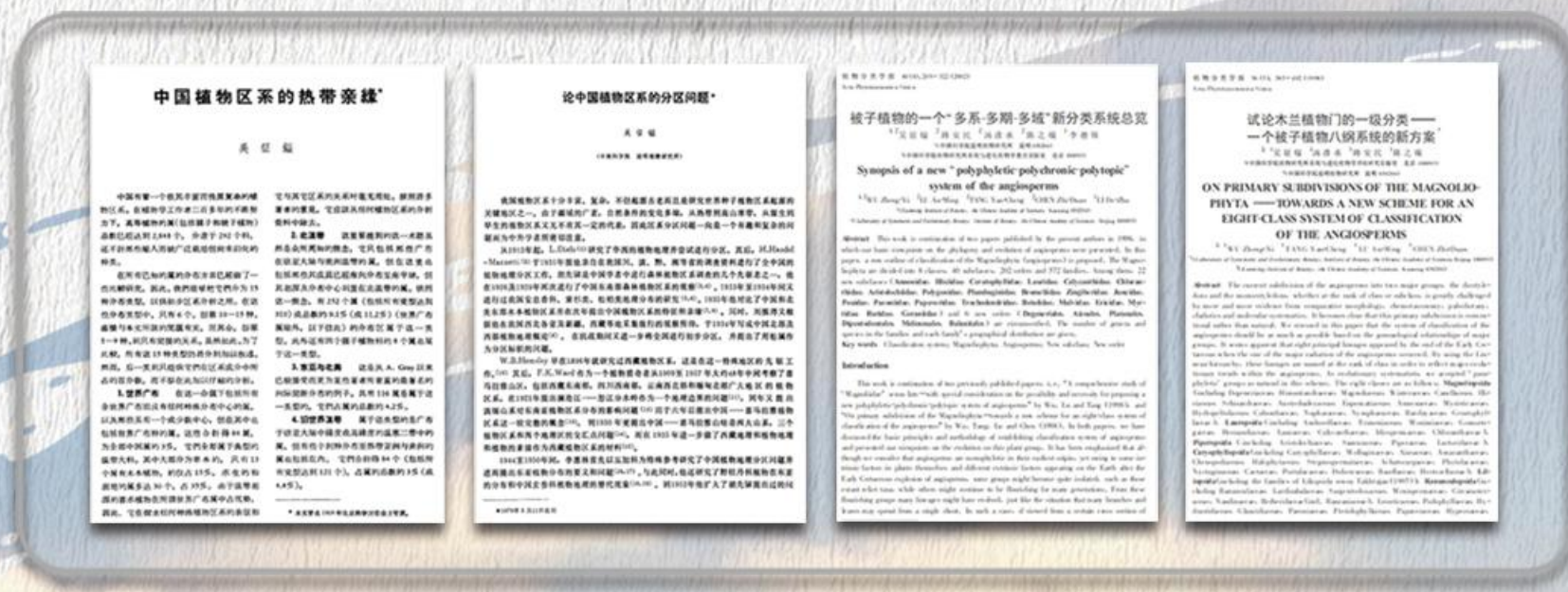
吴征镒提出植物区系思想体系和被子植物起源等新理论

1964 年,吴征镒发表《中国植物区系的热带亲缘》,提出“在北纬 20°—40° 间的中国南部、西南部和印度支那地区是东亚植物区系的摇篮,也是北美洲和欧洲等北温带植物区系的发源地”的理论。他创立的生物三维律动演化思想以及被子植物“多系—多期—多域”起源理论和“八纲系统”是东方人在自己研究的基础上,立足东亚,放眼世界提出的被子植物起源和演化的新理论。