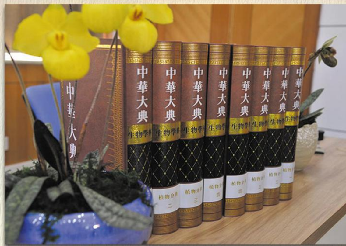
《中华大典·生物学典·植物分典》

耄耋之年的他坚持学术研究，2006年，90岁高龄的吴征镒率领弟子着手整理研究我国清代著名的植物学专著《植物名实图考》及其《长编》，开启了我国植物考据学研究的新篇。2007年他担任了《中华大典·生物典》的主编，此时，吴征镒眼疾已经很严重了，家人不赞成他参与这项繁重的工作，但他说“我不做，谁来做？”继续为编纂这一贯通中外、上下古今的续脉巨著奉献力量。