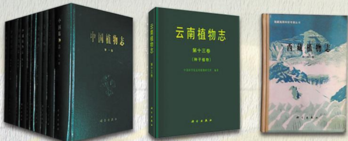
吴征镒主编的《中国植物志》、《云南植物志》和《西藏植物志》

1987 年吴征镒担任《中国植物志》主编,在此期间共出版 82 卷册,约占全志的 2/3。吴征镒是三代植物学家编研全程的见证者,也是《Flora of China》的启动者,他带领中国迈出了植物学走向世界的坚实一步。此外,吴征镒任主编的《云南植物志》和《西藏植物志》,这些著作作为生物多样性、保护生物学、恢复生态学等的研究和发展奠定了坚实的基础,在国际植物分类学研究领域中产生了重要影响。