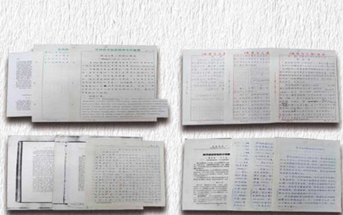
《宾夕法尼亚毛茛两个亚洲近缘种》、 《钡、锶、铯对水绵属的特殊作用》、 《南京钟山之森林》、 《黄河流域植物的分布概说》的手稿

1916年，在国外发表了《宾夕法尼亚毛茛两个亚洲近缘种》，是中国人用拉丁文为植物命名和分类的第一篇文献。钱崇澍主要研究方向为兰科、荨麻科、豆科、樟科、菊科、交让木科等。1959年，钱崇澍牵头组织领导全国植物分类学家开展《中国植物志》编研，与陈焕镛担任共同主编。除任主编外，还承担荨麻科的编写工作，并作为第一完成人获国家自然科学奖一等奖。